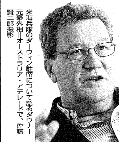
米海兵隊のダーウィン駐留について語るダウナー元豪外相「オーストラリア・アデレード」で

だが、提案は棚上げになった。米軍がアフガンとイラクで身動きできなくなったからだ。昨年5月、アルカイダの最高指導者ウサーマ・ビンラディン容疑者の殺害を受け、「駐留計画は一気に現実味を帯び始めた」(外交筋)という。オバマ大統領は昨年11月、米豪相互安保条約60周年を機に豪州を訪問。北部準州の州都ダーウィンに足を運んだ。大統領は、豪空軍基地の格納庫で豪軍兵士ら約2000人を前に「アジア回帰」への演説を行い、第二次大戦中の出来事に触れた。「私たちの同盟は、ここダーウィンで生まされた。(旧日本軍の)攻撃を受けた時にだ。大統領の声がかたまる格納庫は静まりかえっていた。1942年2月、開戦から破竹の勢いで南下した日本軍は、米豪など連合国軍の拠点ダーウィンを空襲した。豪州での「真珠湾攻撃」と呼ばれる。「アイ・シャル・リターン」(私